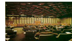
European Court of Auditors