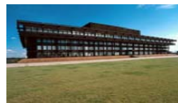
Court of Justice of the European Union